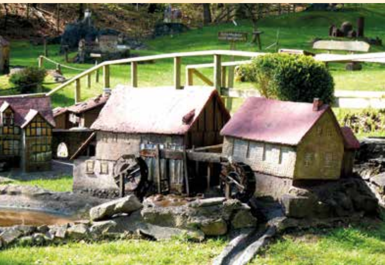
Hexenloch-Mühle im Schwarzwald