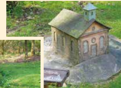
Waldenserkirche in Gewissenruh