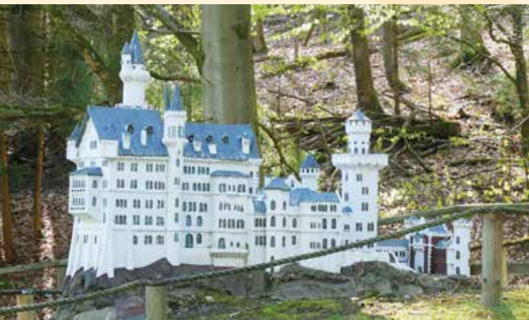
Schloss Neuschwanstein bei Füssen

Aus der Leidenschaft des Künstlers Richard Wittich heraus entstand der Mühlenplatz in Wesertal Ortsteil Gieselwerder. Ihr findet ihn entlang der Deutschen Märchenstraße am Rand von Gieselwerder auf einer Waldwiese. Der kleine Lumbach plätschert dort vor sich hin und ist ein wichtiger Bestandteil der Anlage. Höhen- und Wasserburgen, Schlossanlagen, manch` eine Kirche oder ein anderes bekanntes Bauwerk aus einer Zeit, als Rotkäppchen noch durch den Wald lief, wurden maßstabsgerecht nachgebaut und erfreuen das Auge.