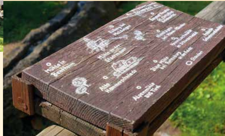
Hinweis-Tafeln im Mühlenplatz

In einer Abteilung sind Kirchen unserer Region zusammengestellt, eine andere zeigt historische Rathäuser. Ein besonderer Blickfang sind jedoch bekannte Höhenburgen, Wasserburgen und Schlossanlagen.