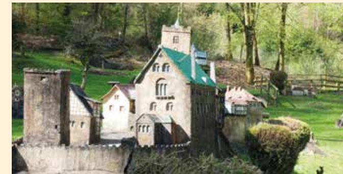
Die historische Wartburg in Eisenach