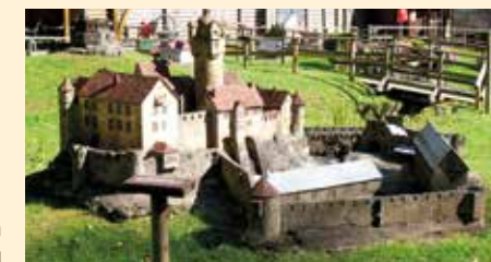
Ronneburg nördlich von Hanau