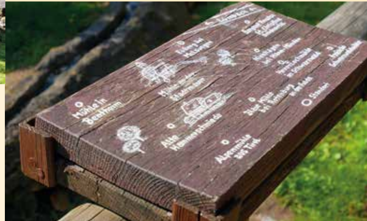
Hinweis-Tafeln im Mühlenplatz

In einer Abteilung sind Kirchen unserer Region zusammengestellt, eine andere zeigt historische Rathäuser. Ein besonderer Blickfang sind jedoch bekannte Höhenburgen, Wasserburgen und Schlossanlagen.